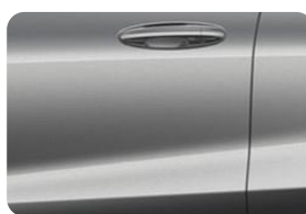
Solar Silver Metalická