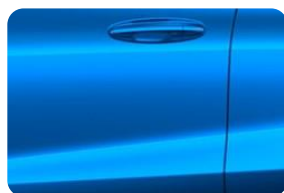
Desert Island blue Metalická