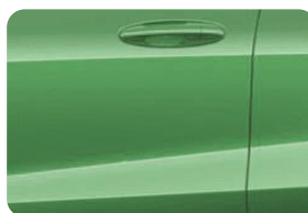
Bursting Green Metalická