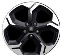
17" Magnetic D2YBV