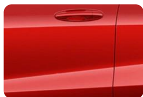
Fantastic Red Metalická