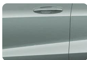
Cactus Gray Nemetalická