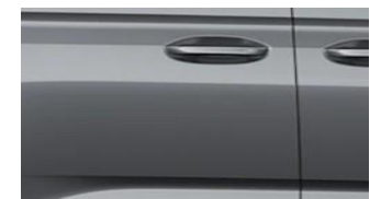
Graphite Grey Metalická