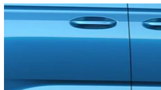
Boundless Blue Metalická