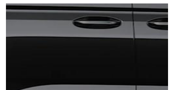
Intense Black Metalická