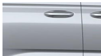
Stardust Silver Metalická