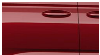
Red Maple Metalická