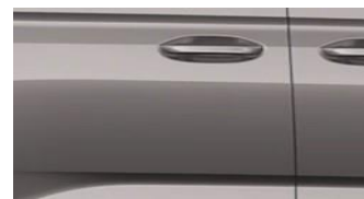
Dusky silver Metalická