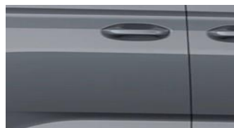
Steel Grey Nemetalická