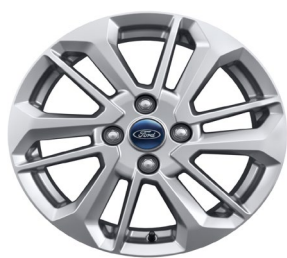
16" x 6.5" sériová výbava pre Titanium