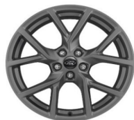
19" hliníkové disky sériová výbava pre ST