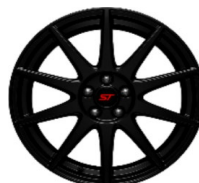
19" hliníkové disky súčasť Sady ST Track