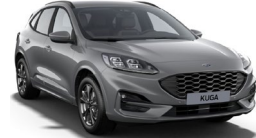
Solar Silver metalická