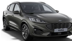
Magnetic Grey metalická