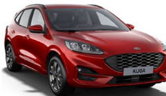
Lucid Red metalická