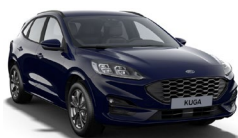
Blazer Blue nemetalická