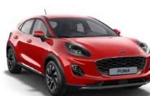
Fantastic Red metalická