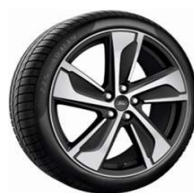
19" x 7.5" voliteľná výbava pre ST-Line X