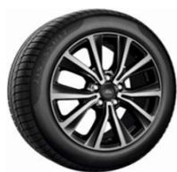
17" x 7.0" voliteľná výbava pre Titanium