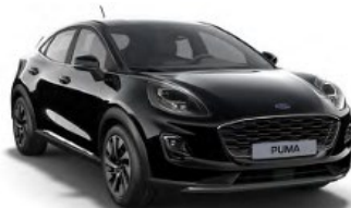
Agate Black metalická