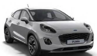
Grey Matter nemetalická