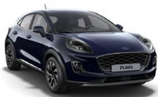
Blazer Blue nemetalická