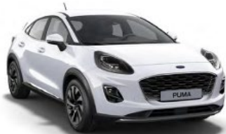
Frozen White nemetalická