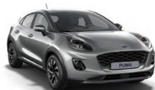
Solar Silver metalická