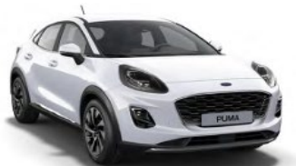
Frozen White nemetalická