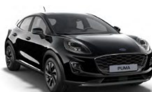
Agate Black metalická