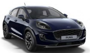
Blazer Blue nemetalická