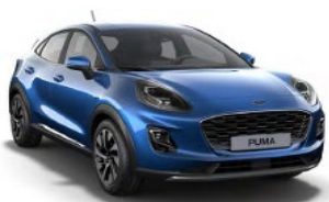
Desert Island Blue metalická