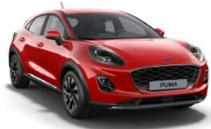
Fantastic Red metalická