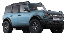
Area 51 prémiová nemetalická