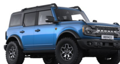
Velocity Blue prémiová metalická