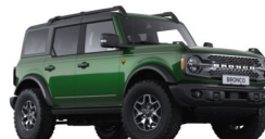
Eruption Green metalická