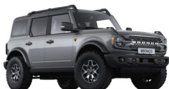
Carbonized Gray metalická