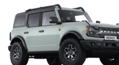
Cactus Gray prémiová metalická