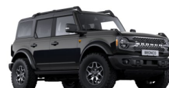
Absolute Black nemetalická