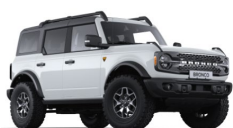
Oxford White nemetalická

■ štandardná výbava — nie je k dispozícii □ v pakete