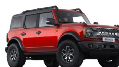
Hot Pepper Red prémiová metalická