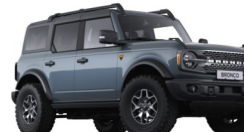
Azure Gray prémiová metalická