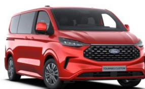
Artisan Red metalická