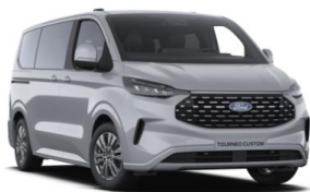
Grey Matter prémiová nemetalická