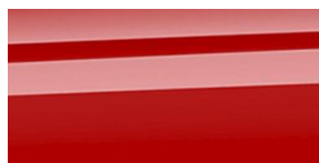
Race Red nemetalická