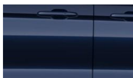
Blazer Blue nemetalická