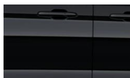
Agate Black metalická