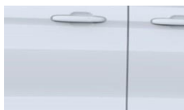
Frozen White nemetalická

● štandardná výbava - nie je k dispozícii