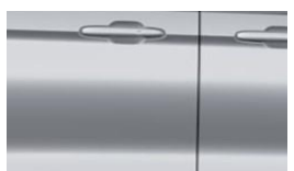
Moondust Silver metalická