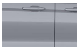
Grey Matter prémiová nemetalická