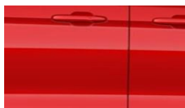
Race Red nemetalická