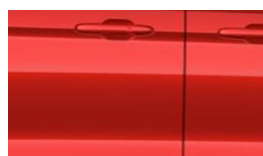
Artisan Red metalická