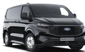
Agate Black metalická