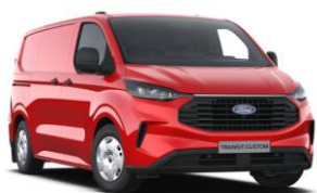
Race Red nemetalická