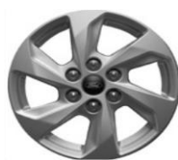
16" Sparkle Silver voliteľne Trend