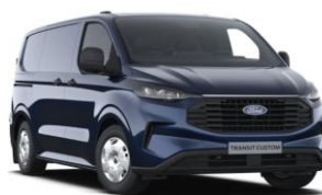
Blazer Blue nemetalická