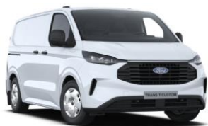
Frozen White nemetalická