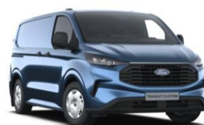
Blue Metallic metalická