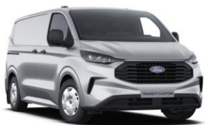
Moondust Silver metalická