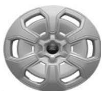
16" oceľové disky s krytmi séria Trend