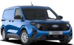
Desert Island blue Metalická