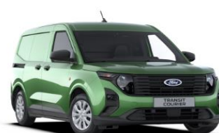
Bursting Green Metalická