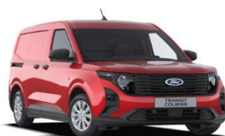
Fantastic Red Metalická