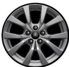
16" Sparkle Silver -zliatinové