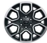
20" zliatinové disky voliteľne Wildtrak