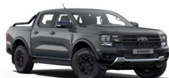
Conquer Grey FORD Performance