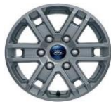
16" zliatinové disky séria XLT