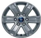
17" zliatinové disky voliteľne pre XLT