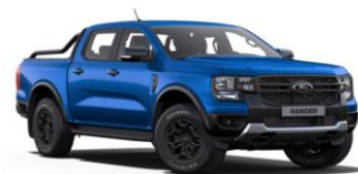
Blue Lighting metalická