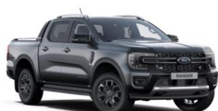
Carbonized Grey metalická