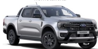
Iconic Silver metalická