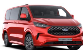
Artisan Red metalická