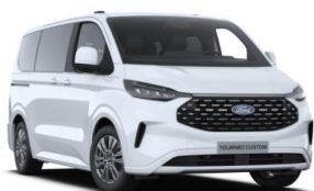
Frozen White nemetalická