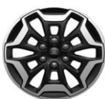
17" Active séria Active