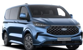
Blue Metallic metalická