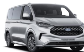
Moondust Silver metalická