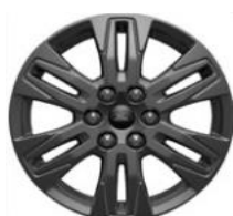
17" Carbonised Grey séria Titanium