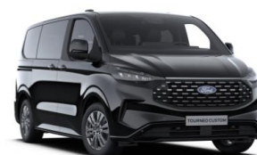
Agate Black metalická