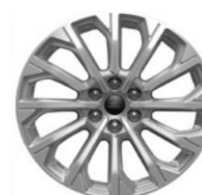
19" Lustre Nickel voliteľne Titanium / Titanium X

PRÍSLUŠENSTVO FORD www.ford-prislusenstvo.sk