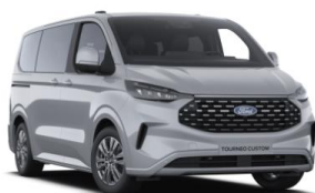
Grey Matter prémiová nemetalická