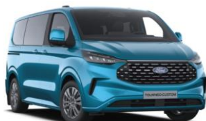
Digital Aqua Blue metalická