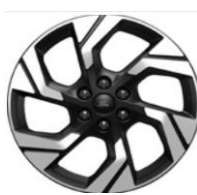
19" Active voliteľne Active