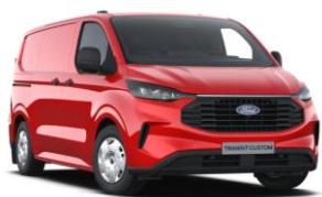
Race Red nemetalická