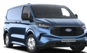
Blue Metallic metalická