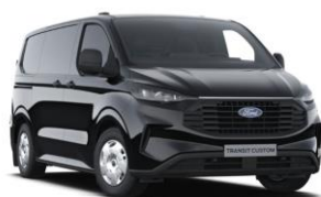
Agate Black metalická