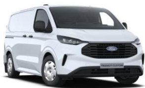
Frozen White nemetalická