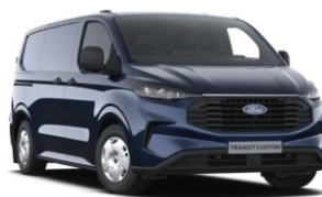
Blazer Blue nemetalická