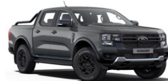
Conquer Grey FORD Performance