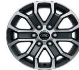
18" zliatinové disky voliteľne Limited