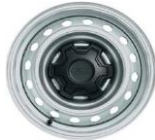
16" Oceľové disky séria XL