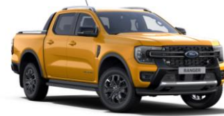
Cyber Orange metalická