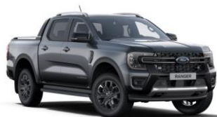
Carbonized Grey metalická