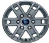
16" zliatinové disky séria XLT