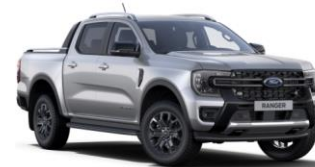
Iconic Silver metalická