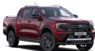
Lucid Red metalická