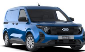
Desert Island blue Metalická