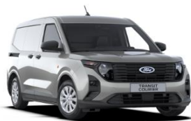
Solar Silver Metalická