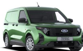
Bursting Green Metalická