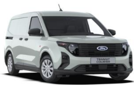
Cactus Gray Nemetalická