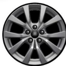
16" Sparkle Silver - zliatinové D2XCH