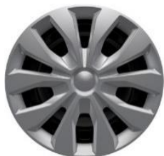
15" oceľové disky s krytmi kolies séria