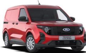
Fantastic Red Metalická