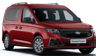
Red Maple Metalická