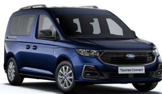
Midnight Blue Metalická