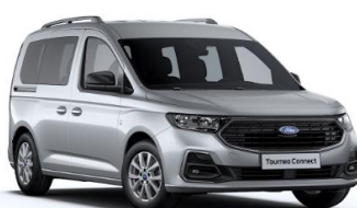
Stardust Silver Metalická