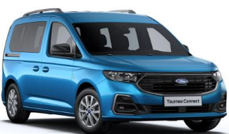
Boundless Blue Metalická