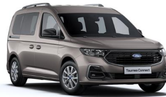
Dusky silver Metalická