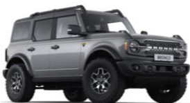
Carbonized Gray metalická