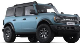
Area 51 prémiová nemetalická