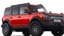
Hot Pepper Red prémiová metalická