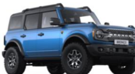
Velocity Blue prémiová metalická