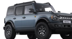
Azure Gray prémiová metalická