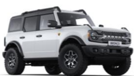
Oxford White nemetalická

● štandardná výbava — nie je k dispozícii □ v pakete