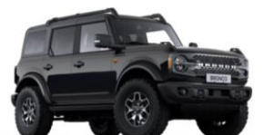
Absolute Black nemetalická