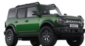
Eruption Green metalická