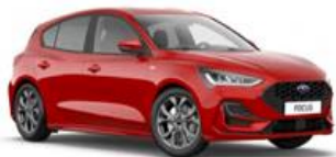
Race Red nemetalická

● štandardná výbava ■ nie je k dispozícii □ dostupné v pakete