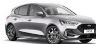
Moondust Silver metalická