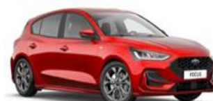
Fantastic Red metalická