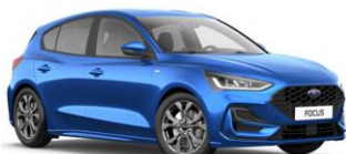
Desert Island Blue metalická