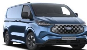
Blue Metallic metalická