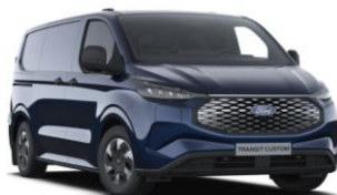
Blazer Blue nemetalická