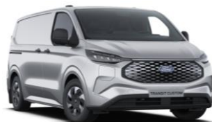
Moondust Silver metalická