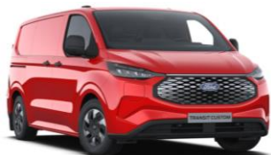
Race Red nemetalická