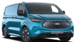
Digital Aqua Blue metalická