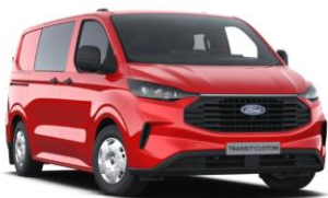
Race Red nemetalická