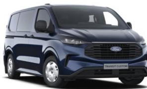
Blazer Blue nemetalická