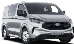
Moondust Silver metalická