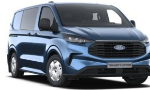
Blue Metallic metalická