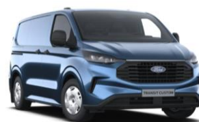
Blue Metallic metalická