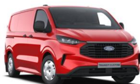
Race Red nemetalická