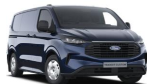
Blazer Blue nemetalická