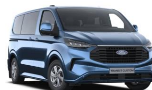
Blue Metallic metalická