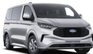
Moondust Silver metalická