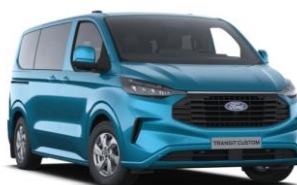
Digital Aqua Blue metalická