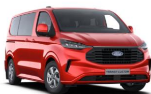
Artisan Red metalická