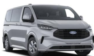
Grey Matter prémiová nemetalická