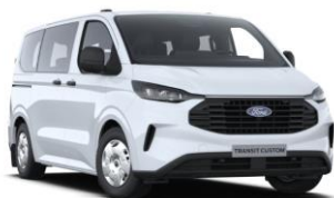
Frozen White nemetalická