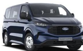
Blazer Blue nemetalická