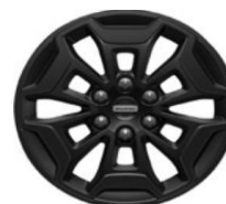
17" matné Magnetic voliteľne Trail