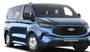
Blue Metallic metalická