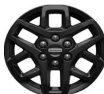
16" matné Black séria Trail