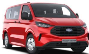
Race Red nemetalická