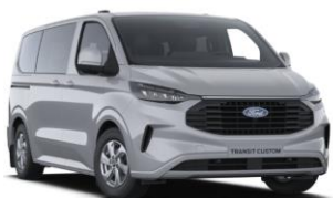
Grey Matter prémiová nemetalická