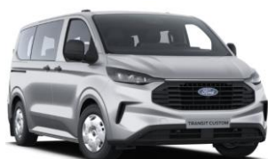
Moondust Silver metalická