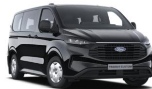
Agate Black metalická