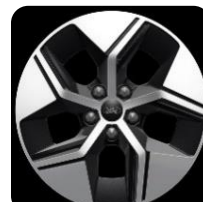
17" leštené - zliatinové D2YGQ