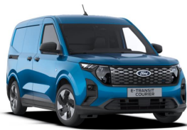
Digital Aqua Blue Metalická