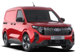
Fantastic Red Metalická