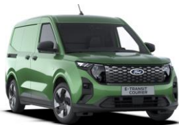
Bursting Green Metalická