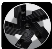
16" oceľové disky s krytmi kolies séria