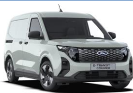
Cactus Gray Nemetalická