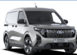
Solar Silver Metalická