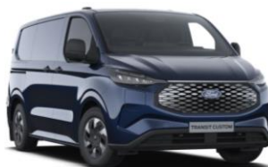
Blazer Blue nemetalická