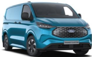
Digital Aqua Blue metalická