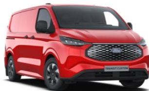
Race Red nemetalická