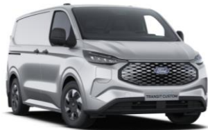
Moondust Silver metalická