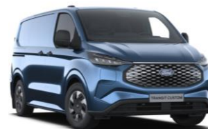
Blue Metallic metalická