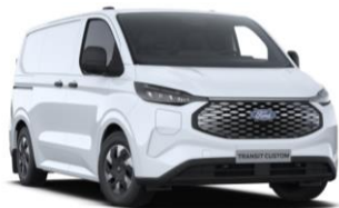
Frozen White nemetalická