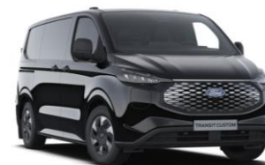
Agate Black metalická