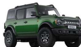
Eruption Green metalická