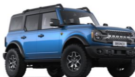
Velocity Blue prémiová metalická