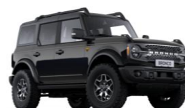
Absolute Black nemetalická