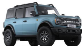
Area 51 prémiová nemetalická