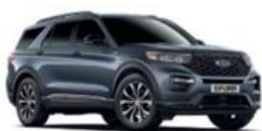
Flight Blue metalická