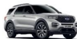
Iconic Silver metalická