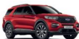
Lucid Red metalická