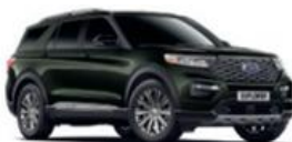
Forged Green metalická