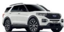
Oxford White nemetalická

● štandardná výbava — nie je k dispozícii □ v pakete