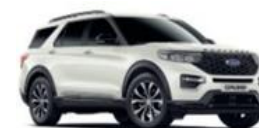
Star White metalická