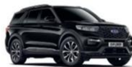
Agate Black metalická