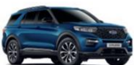
Atlas Blue metalická