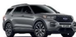
Carbonized Gray metalická