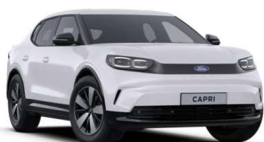
Frozen White nemetalická