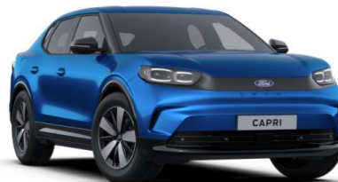
Blue My Mind prémiová metalická