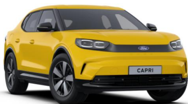
Vivid Yellow nemetalická