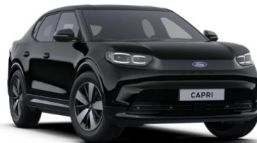
Agate Black metalická