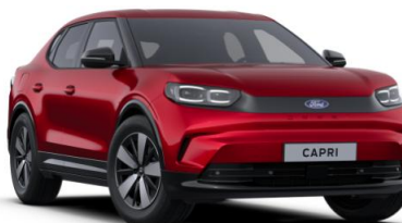
Lucid Red prémiová metalická