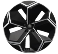
21" zliatinové disky čierna Asphalt Matt Voliteľne D2GCV