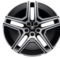
20" zliatinové disky šedá Magnetic Línia výbavy Premium