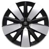
19" zliatinové disky čierna Absolute Línia výbavy Capri (EV MAX)