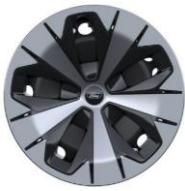
19" oceleové disky s celoplošnými aero. krytmi (EV STD)