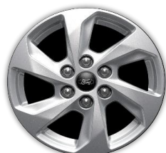
16" disky z ľahkých zliatin voliteľne D2XCH