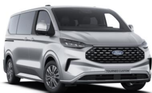
Moondust Silver metalická