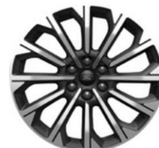
19" Pearl Grey voliteľne Titanium