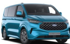
Digital Aqua Blue metalická