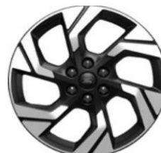
19" Active voliteľne Active