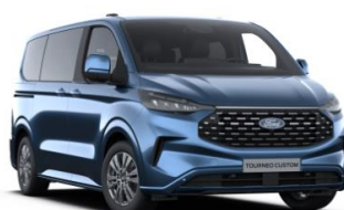
Blue Metallic metalická