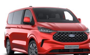
Artisan Red metalická