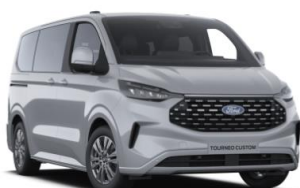
Grey Matter prémiová nemetalická