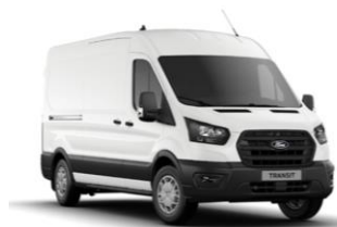
Frozen White nemetalická