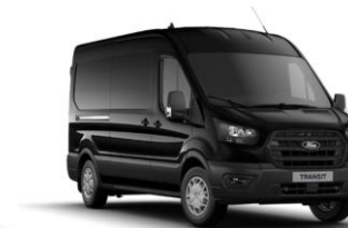
Agate Black metalická