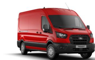
Race Red nemetalická