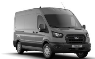
Grey Matter prémiová nemetalická