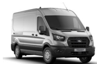
Moondust Silver metalická