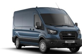
Blue Metallic metalická