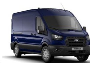
Blazer Blue nemetalická