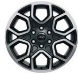
20" zliatinové disky voľiteľne Wildtrak