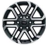
18" zliatinové disky séria Limited