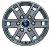
16" zliatinové disky séria XLT