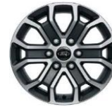
18" zliatinové disky voľiteľne Limited