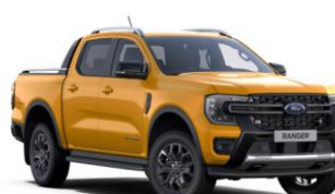
Cyber Orange metalická