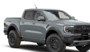
Command Grey FORD Performance