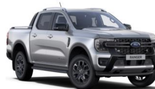
Iconic Silver metalická