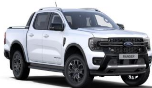
Frozen White nemetalická