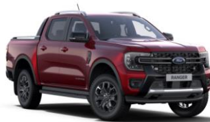
Lucid Red metalická