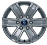
17" zliatinové disky voľiteľne pre XLT