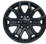
18" zliatinové disky séria Wildtrak