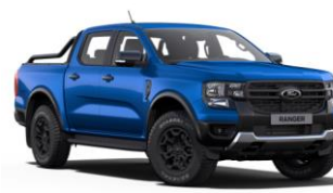
Blue Lighting metalická