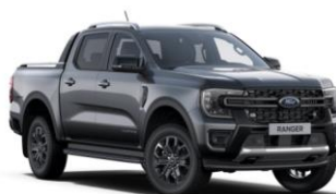
Carbonized Grey metalická