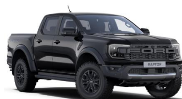
Absolute Black metalická