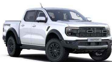
Arctic White nemetalická