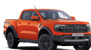
Code Orange FORD Performance