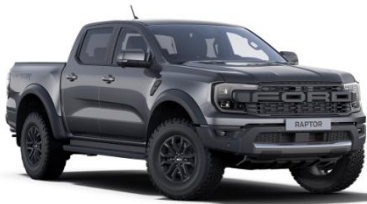
Meteor Grey metalická