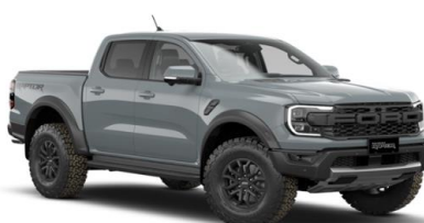
Command Grey FORD Performance