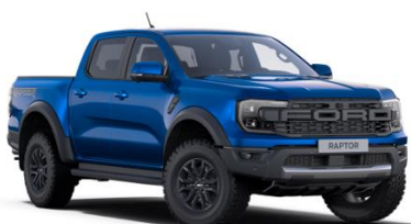
Blue Lightning metalická