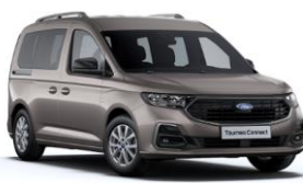
Dusky silver Metalická