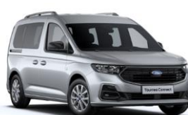
Stardust Silver Metalická