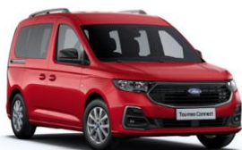
Lava Red Nemetalická