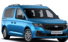
Boundless Blue Metalická