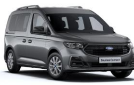
Graphite Grey Metalická