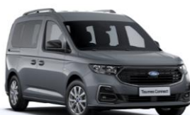
Steel Grey Nemetalická