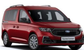
Red Maple Metalická