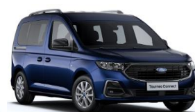
Midnight Blue Metalická