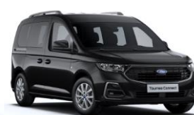
Intense Black Metalická