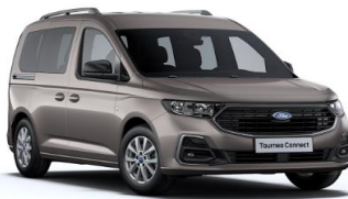
Dusky silver Metalická