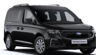
Intense Black Metalická