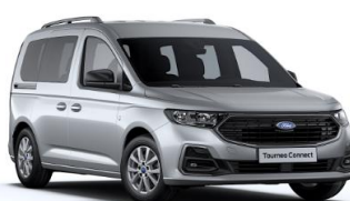
Stardust Silver Metalická