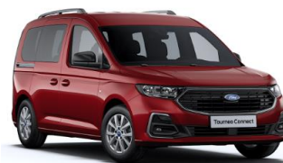
Red Maple Metalická