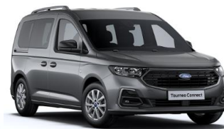
Graphite Grey Metalická