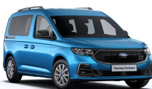
Boundless Blue Metalická