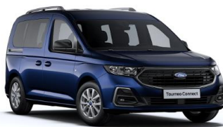
Midnight Blue Metalická