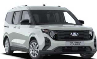
Cactus Gray Nemetalická