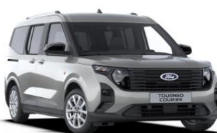
Solar Silver Metalická