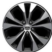
17" Magnetic D2YBV