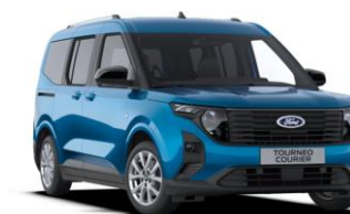
Digital Aqua Blue Metalická