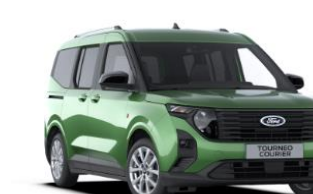
Bursting Green Metalická