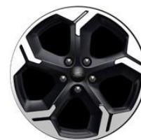
17" Agate black Active séria