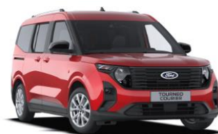
Fantastic Red Metalická