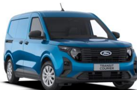
Digital Aqua blue Metalická