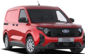
Fantastic Red Metalická