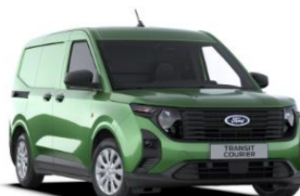
Bursting Green Metalická