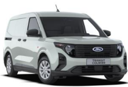
Cactus Gray Nemetalická