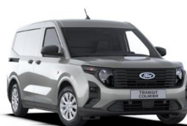
Solar Silver Metalická