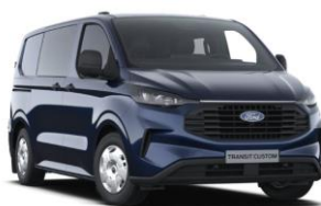
Blazer Blue nemetalická