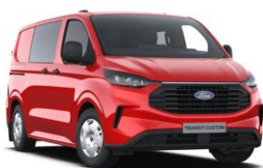
Race Red nemetalická