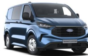
Blue Metallic metalická