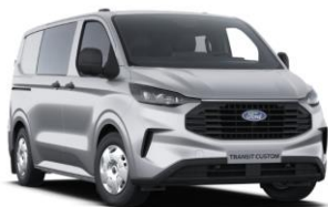
Moondust Silver metalická