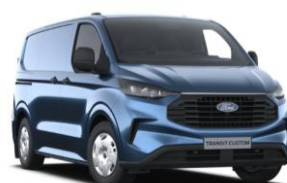
Blue Metallic metalická