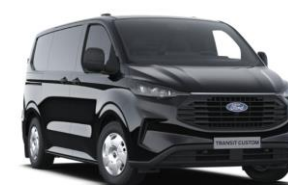
Agate Black metalická