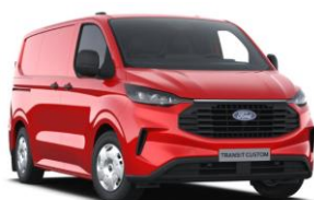
Race Red nemetalická