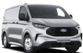
Moondust Silver metalická