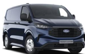
Blazer Blue nemetalická