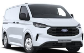
Frozen White nemetalická