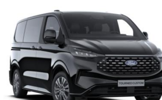
Agate Black metalická