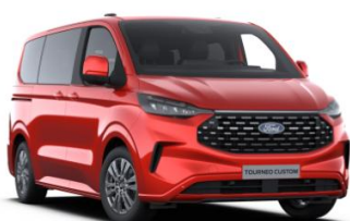
Artisan Red metalická