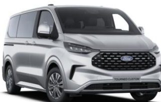
Moondust Silver metalická