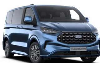
Blue Metallic metalická