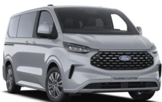
Grey Matter prémiová nemetalická