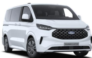
Frozen White nemetalická