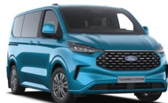
Digital Aqua Blue metalická