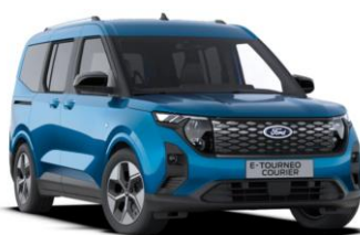
Digital Aqua Blue Metalická