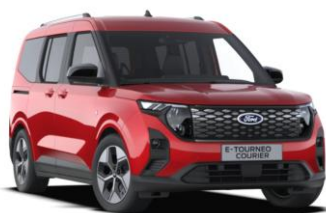
Fantastic Red Metalická