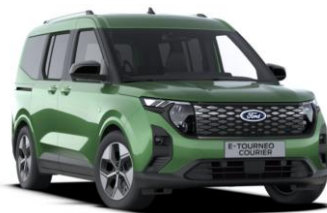
Bursting Green Metalická