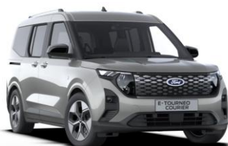
Solar Silver Metalická