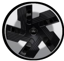
16" oceľové disky Trend séria