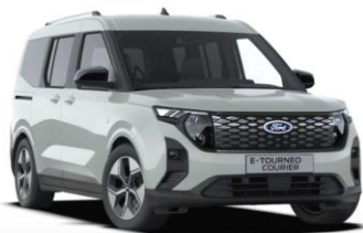
Cactus Gray Nemetalická