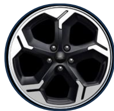
17" zliatinové Agate black Titanium a Active séria