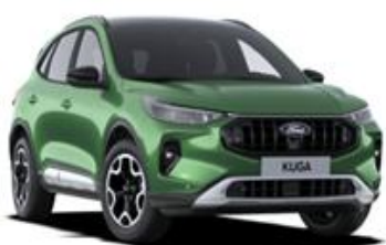
Bursting Green Metalická