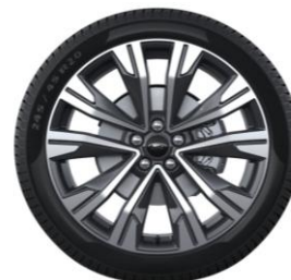
20" x 8.0" voliteľná výbava pre ST-Line X a Active X D2FCX