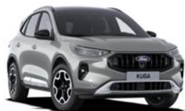
Solar Silver Metalická