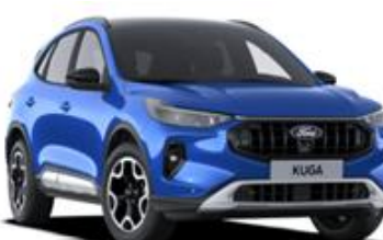
Desert Island blue Metalická