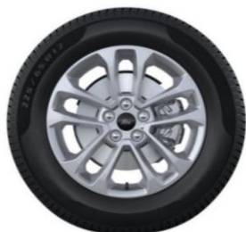
17" x 7.0" sériová výbava pre Titanium