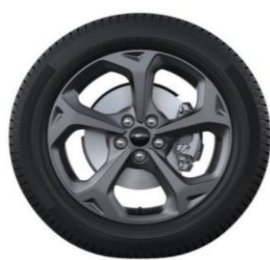
18" x 7.5" sériová výbava pre ST-Line a ST-Line X