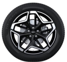
19" x 7.5" voliteľná výbava pre ST-Line a ST-Line X D2VL5