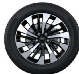
18" x 7.5" voliteľná výbava pre Titanium D2ULT