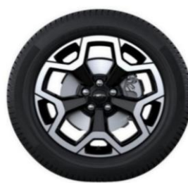
18" x 7.5" sériová výbava pre Active X