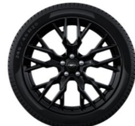
20" x 8.0" voliteľná výbava v rámci Sady Black