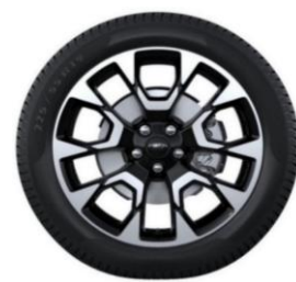
19" x 7.5" voliteľná výbava pre Active X D2VBH