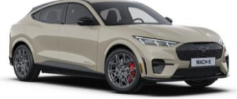
Terrain Sand metalická