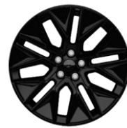
19" zliatinové disky čierne voliteľné pre Premium D2VCN