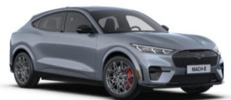
Glacier Grey metalická