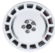
19" zliatinové disky biele voliteľné k sade Mach-E Rally D2VL1