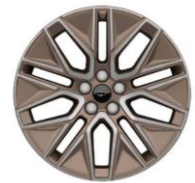
19" zliatinové disky bronzové voliteľné pre Premium D2VCH