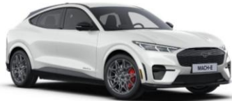
Star White metalická