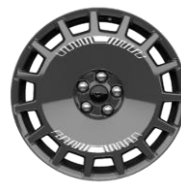
19" zliatinové disky sivé sada Mache-E Rally