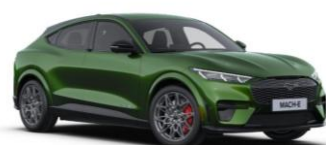
Eruption Green metalická