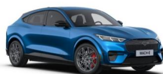
Velocity Blue metalická