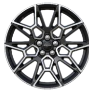
20" zliatinové disky sériová výbava pre GT