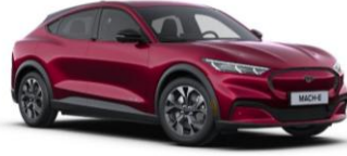
Molten Magenta metalická