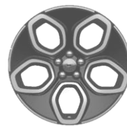
20" zliatinové disky šedé sada California Special