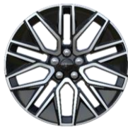
19" zliatinové disky sériová výbava pre Premium