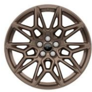
20" zliatinové disky bronzové sada Bronz Do vypredania zásob