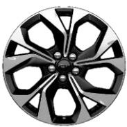
19" zliatinové disky sériová výbava pre Mach-E