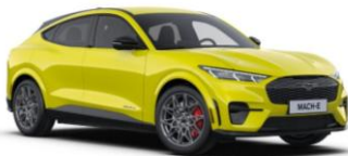
Grabber Yellow nemetalická