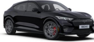
Absolute Black metalická