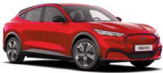
Race Red nemetalická