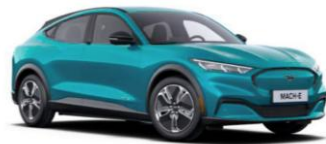
Adriatic Blue-Green metalická