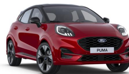
Fantastic Red metalická