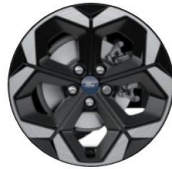
18" disky z ľahkej zliatiny Sériová výbava pre ST-Line X