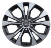
17" disky z ľahkej zliatiny, Voliteľná výbava Titanium D2YGR