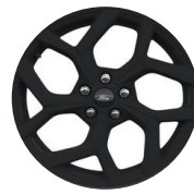
18" disky z ľahkej zliatiny Sada BLACK AGGAJ