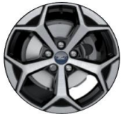
17" disky z ľahkej zliatiny s povrchovou úpravou Sériová výbava pre ST-Line