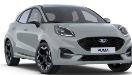
Cactus Gray nemetalická