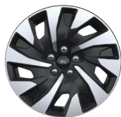
17" oceleové disky s celoplošnými krytmi Sériová výbava pre Titanium