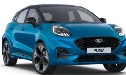
Digital Aqua Blue metalická