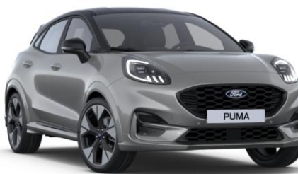
Solar Silver metalická