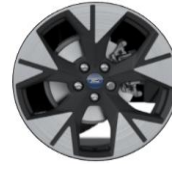
19" disky z ľahkej zliatiny Voliteľná výbava ST-Line a ST-Line X D2VCA