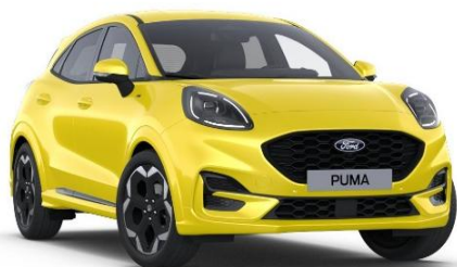
Electric Yellow metalická

● štandardná výbava - nie je k dispozícii □ dostupné v pakete