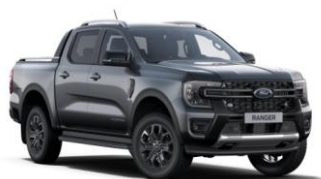
Carbonized Grey metalická