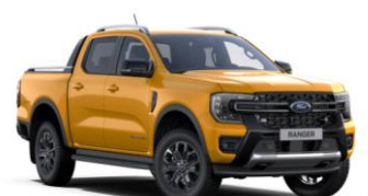
Cyber Orange metalická