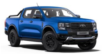
Blue Lighting metalická