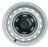
16" Oceleové disky séria XL