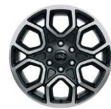
20" zliatinové disky voliteľne Wildtrak