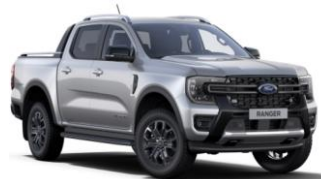
Iconic Silver metalická