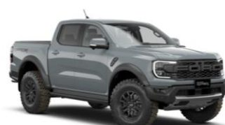
Command Grey FORD Performance