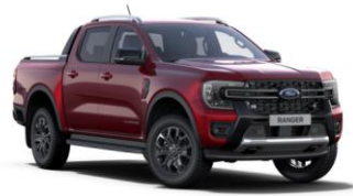
Lucid Red metalická