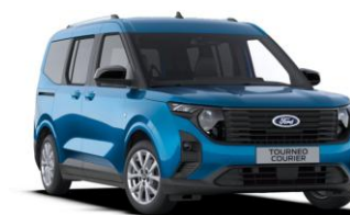
Digital Aqua Blue Metalická