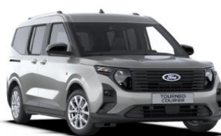
Solar Silver Metalická