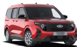
Fantastic Red Metalická