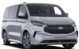
Grey Matter prémiová nemetalická