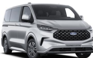
Moondust Silver metalická